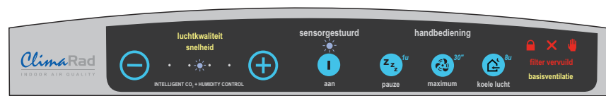
Bedieningspaneel type I

Uw radiator bedient u, zoals u gewend bent, met de radiatorknop aan de zijkant van de radiator. Het ClimaRad ventilatietoestel bedient u met het bedieningspaneel aan de bovenzijde van de radiator.