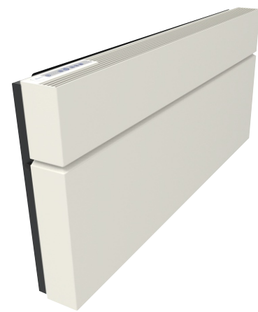
ClimaRad Care H1C