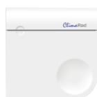
CO 2 -sensor

via de CO 2 -sensor (optioneel) (standaard instelling; 1.000 ppm)