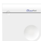
CO 2 -sensor

via de CO 2 -sensor (optioneel) (standaard instelling; 1.000 ppm)