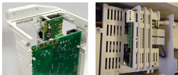
De ClimaRad Communicatiemodule